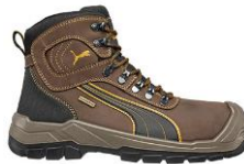
SIERRA NEVADA MID 630220