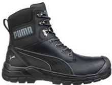
CONQUEST BLACK CTX HIGH 630730