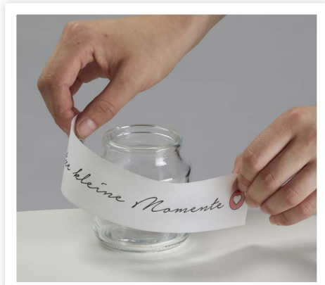
Während das Rad trocknet, druckst oder beschriftest du selbst entworfene Sprüchebanner aus und klebst sie auf die Gläser.