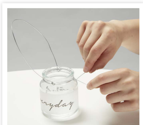
Diese Bügel befestigst du an den Gläsern , indem du die Ösen durch ein weiteres Stück Draht flechtest und dieses fest um die Schrauböffnung wickelst.