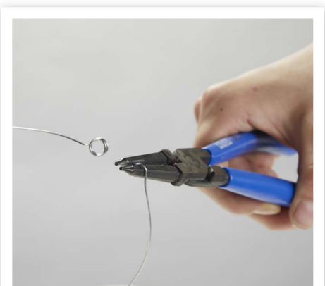
... und forme daraus mit der Flachzange Bügel mit einer stabilen Öse an jedem Ende.