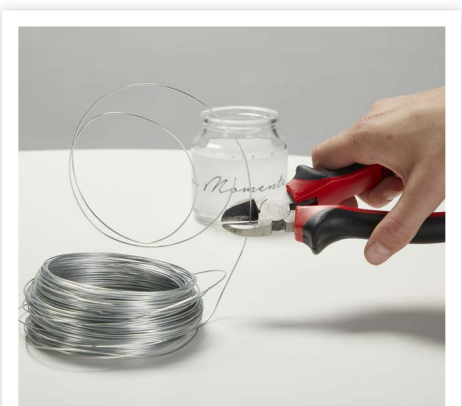
Schneide nun mit der Kneifzange den Draht zu ...