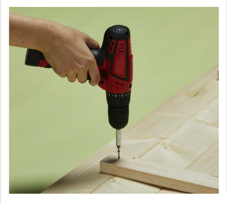
Säge die Dachlatten in Stücke und bringe sie entsprechend der jeweiligen Leitersprossenbreite auf der Rückseite der Regalbretter an.