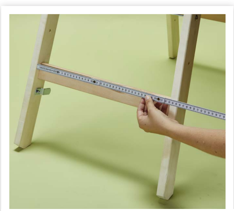
Als erstes misst du anhand der Leiter die Länge und Breite der Holz Bretter aus.