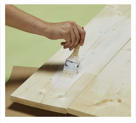
Nun bekommen die Bretter einen Anstrich mit der weißen (oder auf Wunsch auch einer anderen) Farbe.