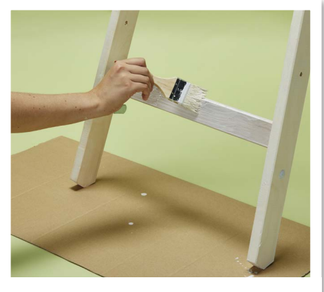
Anschließend wird die Leiter mit derselben Farbe lasiert.