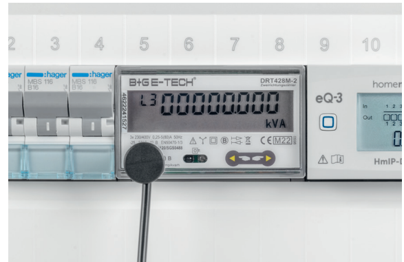
Montage an einem Stromzähler

Anschließend wird der Sensor mit der Schnittstelle verbunden und über die App ins Smart Home integriert – fertig!