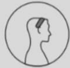
Oberseite des Kopfes