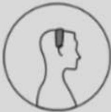
Mitte des Kopfes