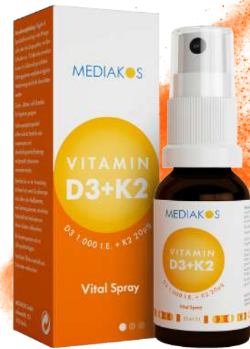
MEDIAKOS Vitamin D3 + K2 1.000 I.E. / 20 µg. Vital Spray Inhalt: 20 ml. PZN: 18133279