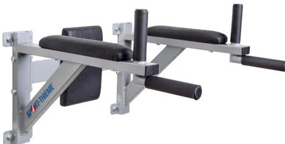
Abbildung 1: Wandhalterung für Dipstation

Bewahren Sie die Anleitung gut auf. Für Fragen und Wünsche stehen wir Ihnen gerne zur Verfügung.