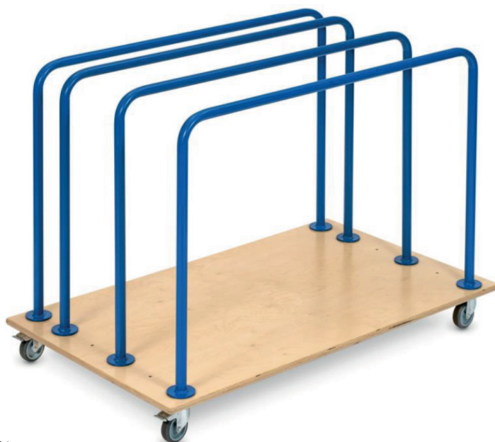
Abbildung 1: Sport-Thieme Transportwagen Mini

Damit Sie viel Freude an diesem Produkt haben und die Sicherheit gewährleistet ist, sollten Sie diese Anleitung vor dem Gebrauch zunächst vollständig durchlesen. Bewahren Sie die Anleitung gut auf. Für Fragen und Wünsche stehen wir Ihnen gerne zur Verfügung.