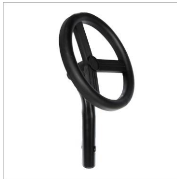
1x Spiel-Lenkrad (ohne Lenkfunktion)