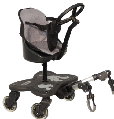
- mit zusätzlichem Sitz EAN 4251056320529