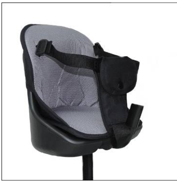
1x Sitz mit Gurtsystem und abnehmbarer Polsterung