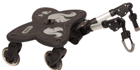
- nur als Board EAN 4251056320512

Der Cozy C-Rider ist in zwei Ausführungen erhältlich: