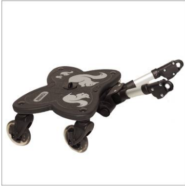
1x C-Rider-Board mit 4 Rädern und Teleskophalterung