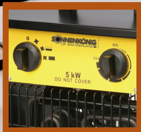
Einfache Bedienung mit Thermostat