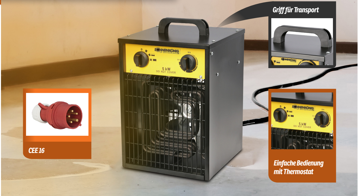
Griff für Transport