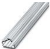
Abdeckprofil, Länge: 300 mm, Farbe: transparent