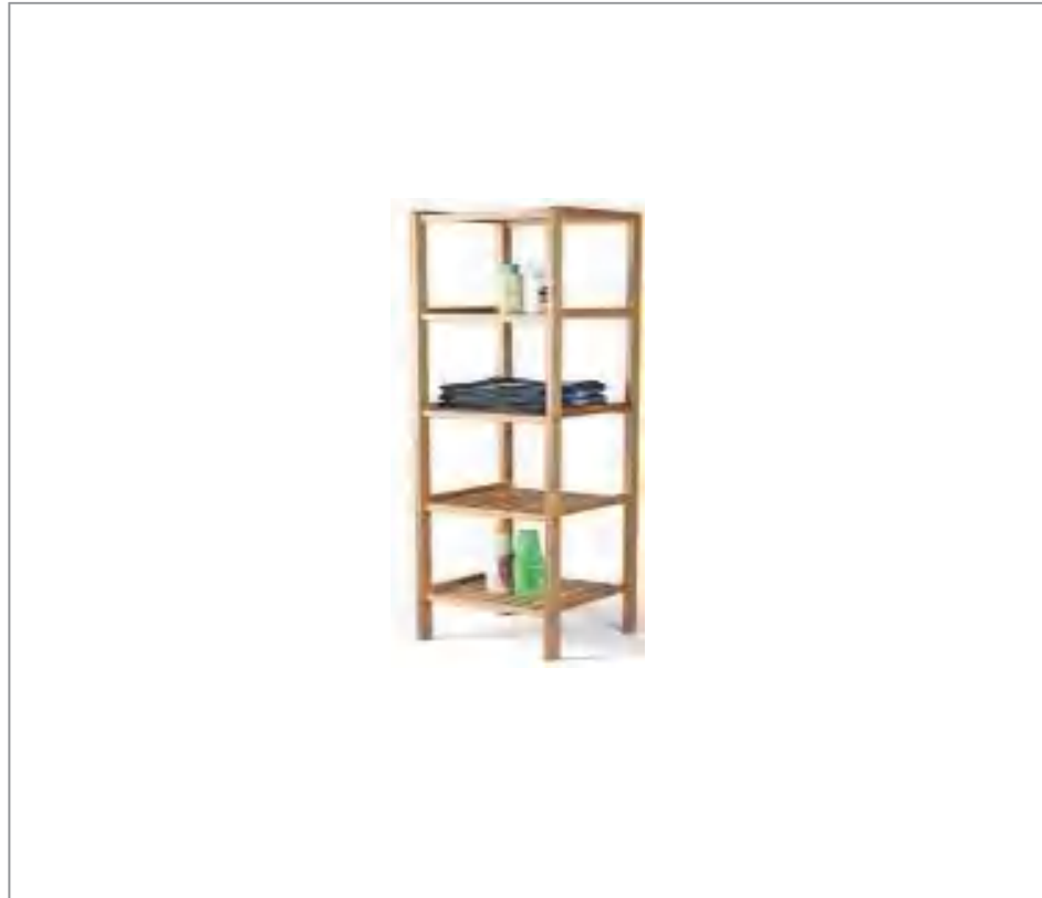
Bambus Regal 5 Ablagen (46309763-74930963)