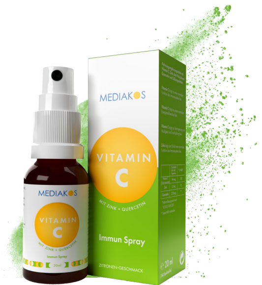
Vitamin C+Zink+Quercetin MEDIKOS Immun Spray Inhalt: 20 ml. PZN: 18369378