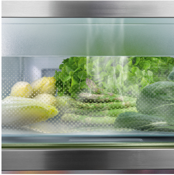
BioFresh mit HydroBreeze

Sie möchten Obst und Gemüse kühlen wie Profis? HydroBreeze wird Sie begeistern: Der kalte Nebel, verbunden mit der Temperatur im Safe knapp über 0 °C, gibt Lebensmitteln den Extra-Kick für längere Haltbarkeit. Und er sorgt für einen optischen Wow-Effekt. HydroBreeze aktiviert sich alle 90 Minuten für 4 Sekunden und für 8 Sekunden bei Türöffnung.