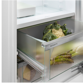
Fruit & Vegetable-Safe

Sie möchten Obst und Gemüse kühlen wie Profis? HydroBreeze wird Sie begeistern: Der kalte Nebel, verbunden mit der Temperatur im Safe knapp über 0 °C, gibt Lebensmitteln den Extra-Kick für längere Haltbarkeit. Und er sorgt für einen optischen Wow-Effekt. HydroBreeze aktiviert sich alle 90 Minuten für 4 Sekunden und für 8 Sekunden bei Türöffnung.