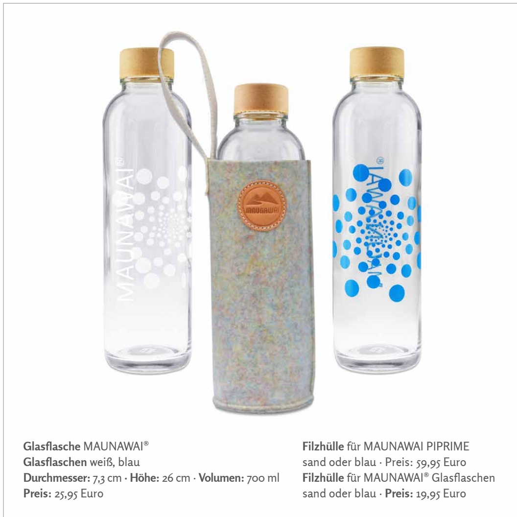
Glasflasche MAUNAWAI® Glasflaschen weiß, blau Durchmesser: 7,3 cm · Höhe: 26 cm · Volumen: 700 ml Preis: 25,95 Euro