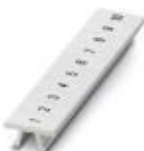
Zackband, Streifen, weiß, beschriftet, längs bedruckt: fortlaufende Zahlen 1 ... 10, 11 ... 20 usw. bis 491 ... 500, Montageart: verrasten in hoher Schildchennut, für Klemmenbreite: 5,2 mm, Schriftfeldgröße: 5,15 x 10,5 mm, Anzahl der Einzelschilder: 10

Zackband - ZB 5,LGS:FORTL.ZAHLEN - 1050017