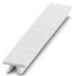
Zackband, bestellbar: streifenweise, weiß, beschriftet nach Kundenangaben, Montageart: verrasten in hoher Schildchennut, für Klemmenbreite: 5,2 mm, Schriftfeldgröße: 5,15 x 10,5 mm, Anzahl der Einzelschilder: 10

Zackband - ZB 5,LGS:FORTL.ZAHLEN - 1050017