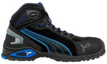
RIO BLACK MID 632250