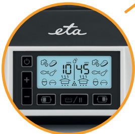
Timer bis 99 Minuten