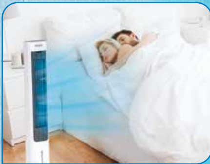
Sorgt für erholsamen Schlaf in heißen Sommernächten