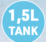
Kühlt & erfrischt mit reinem Wasser