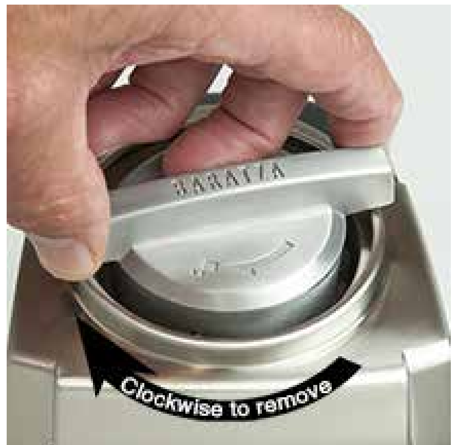
Drehen Sie die Mühle zum Entfernen im Uhrzeigersinn