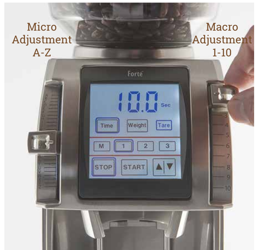
The Forté™ muß in Betrieb sein, wenn Sie den Mahlgrad einstellen

Die ganze Auswahl auf der Mikroskala ist gleichzusetzen mit einem "Klick" oder Positionswechsel auf der Makroskala. Das Ändern des Hebels nach oben produziert eine feinere Konsistenz und das Ändern des Hebels nach unten produziert eine gröbere Konsistenz.