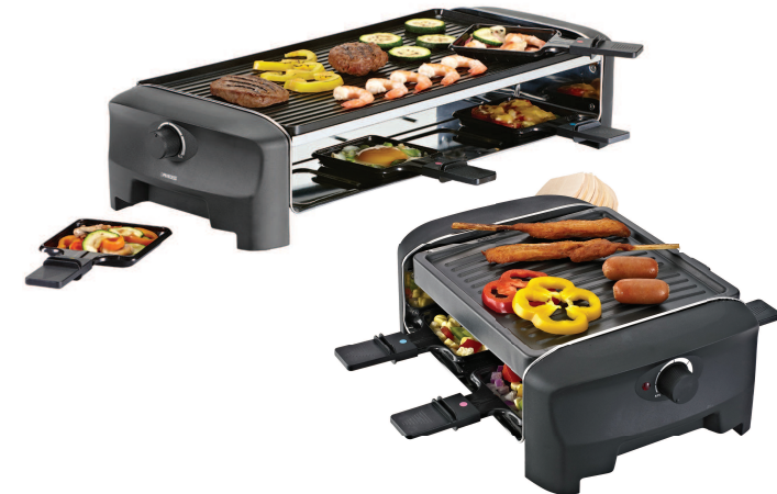
Raclette 4 Grill Party / Raclette 8 Grill and Teppanyaki Party 01.162800.01.001 / 01.162840.01.001

PARTS DESCRIPTION / ONDERDELENBESCHRIJVING / DESCRIPTION DES PIÈCES / TEILEBESCHREIBUNG / DESCRIPCIÓN DE LAS PIEZAS / DESCRIÇÃO DOS COMPONENTES / DESCRIZIONE DELLE PARTI / BESKRIVNING AV DELAR / OPIS CZĘŚCI / POPIS SOUČÁSTÍ / POPIS SUČASTÍ / PARČALARIN AÇIKLAMASI