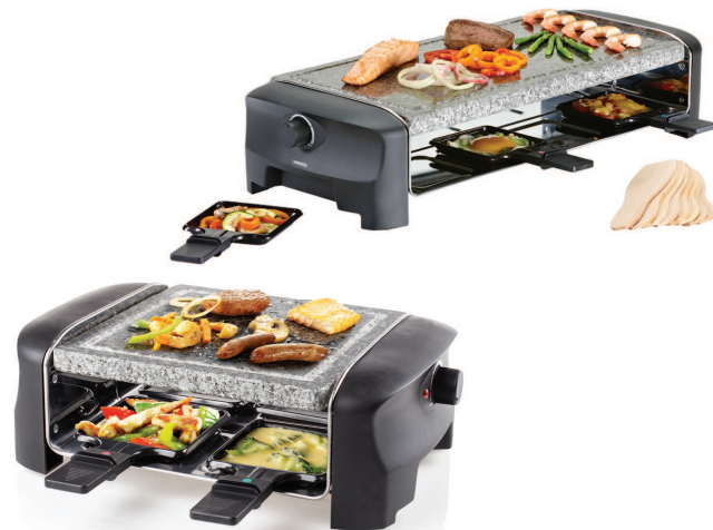
Raclette 4 Stone Grill Party | Raclette 8 Stone Grill Party 01.162810.01.001 | 01.162830.01.001

PARTS DESCRIPTION / ONDERDELENBESCHRIJVING / DESCRIPTION DES PIÈCES / TEILEBESCHREIBUNG / DESCRIPCIÓN DE LAS PIEZAS / DESCRIÇÃO DOS COMPONENTES / DESCRIZIONE DELLE PARTI / BESKRIVNING AV DELAR / OPIS CZĘŚCI / POPIS SOUČÁSTÍ / POPIS SUČASTI / ОПИСАНИЕ ЗАПЧАСТИ