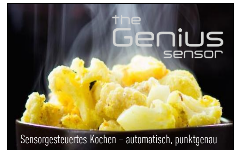
Sensorgesteuertes Kochen – automatisch, punktgenau