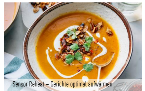
Sensor Reheat – Gerichte optimal aufwärmen