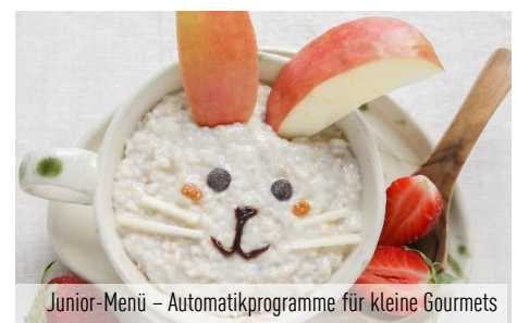
Junior-Menü – Automatikprogramme für kleine Gourmets

Mit der neuen Solo-Mikrowelle bereiten Sie Gerichte clever und besonders appetitlich zu. Dabei helfen sensorgesteuerte Automatikprogramme bei der punktgenauen Zubereitung – ohne weiteres Zutun. Die Sensor Reheat Funktion unterstützt den schnelllebigen Alltag mit ihrer Aufwärmfunktion auf Knopfdruck. Praktische Funktionen wie Schnellstart zum Einstellen der Garzeit in 30-Sekunden-Schritten und ZeitPlus für eine Verlängerung der Garzeit während des Kochvorgangs runden die Programmvierfalt der Solo-Mikrowelle mit Inverter-Technologie ab.