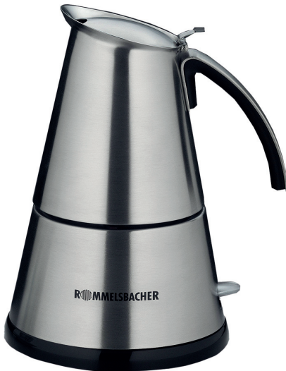
EKO 364/E EKO 366/E