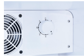
Thermostat Einfache Regelung der Temperatur