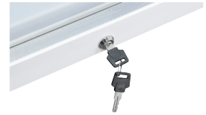
Türschloss Mit der abschließbaren Tür behalten Sie die Kontrolle