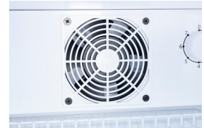
Umluftfunktion Mit der Umluftfunktion kann der Inhalt des Gerätes besser gekühlt werden