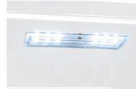
LED-Beleuchtung Dank heller und langlebiger LED-Technik haben Sie den Inhalt ihres Gerätes immer gut im Blick