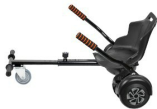
Seitenansicht (mit Balance Board)