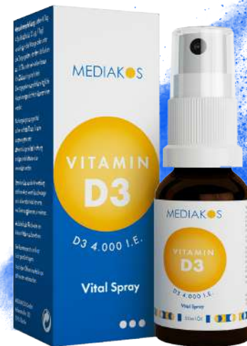
MEDIAKOS Vitamin D3 4.000 I.E. Vital Spray Inhalt: 20 ml. PZN: 18096704