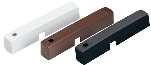
Farbvarianten in Weiß, Braun und Anthrazit

Das im Lieferumfang enthaltene Montagematerial ermöglicht eine Befestigung des Kontakts entweder mit Schrauben oder Klebestreifen. Durch rückstandsloses Entfernen der Klebestreifen ist der Fensterkontakt sogar für Mietwohnungen geeignet.