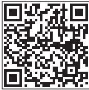
QR-Code für App-Store