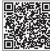
QR-Code für Play Store