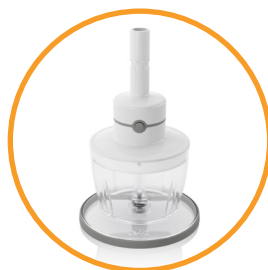
Zerkleinerer (300 ml)