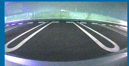
Bildwiedergabe bei Nacht