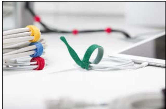
Durch das praktische Kabelbinderdesign kann der TEXTIE am Kabel verbleiben und geht nicht verloren.