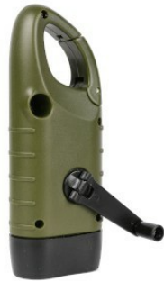
Rückansicht - Kurbel