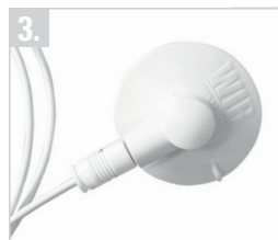
Sauger kann an die gewünschte Position angebracht werden.