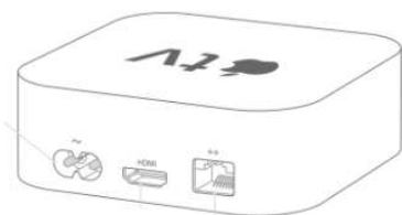
Apple TV 4K