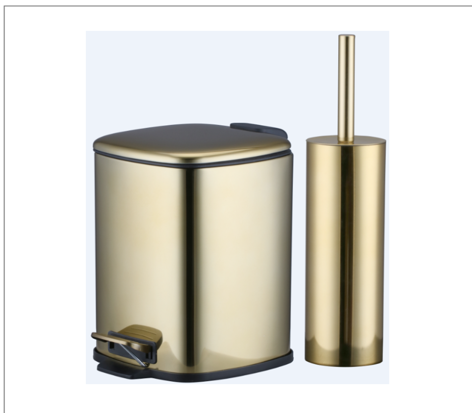
2erSet TME/Klob (76532518)