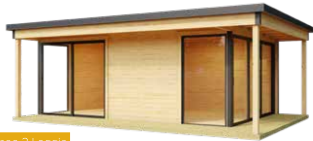
Domeo 3 Loggia