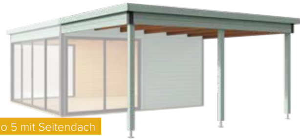
Domeo 5 mit Seitendach

Um diese Serie ultra-funktional zu machen, bieten wir eine Reihe von Dachverlängerungen an. Dies ist die perfekte Lösung, um einen überdachten Außenbereich zu gestalten. Ideal als Unterstand, Grillplatz oder einfach um die frische Luft zu genießen. Wir bieten Domeo-Modelle auch in einer Wandstärke von 70 mm an, die sich problemlos an den ganzjährigen Gebrauch anpassen lassen. Domeo 9 und 10 sind perfekt als ein lichtdurchflutetes Wohnzimmer oder Home Office im Garten. Eine geräumige Terrasse lädt zum Sonnenbaden ein oder zu einem Treffen mit der ganzen Familie an regnerischen Tagen.