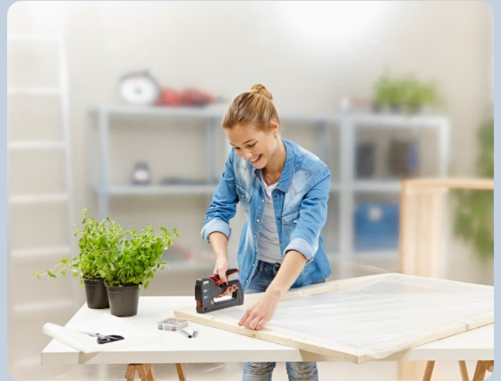
Schnelles Befestigen von Folie.