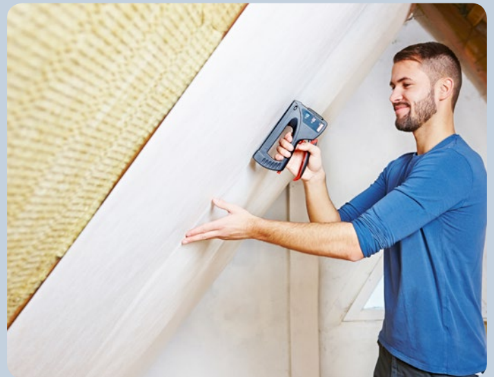
Folie beim Dachbodenausbau einfach befestigen.