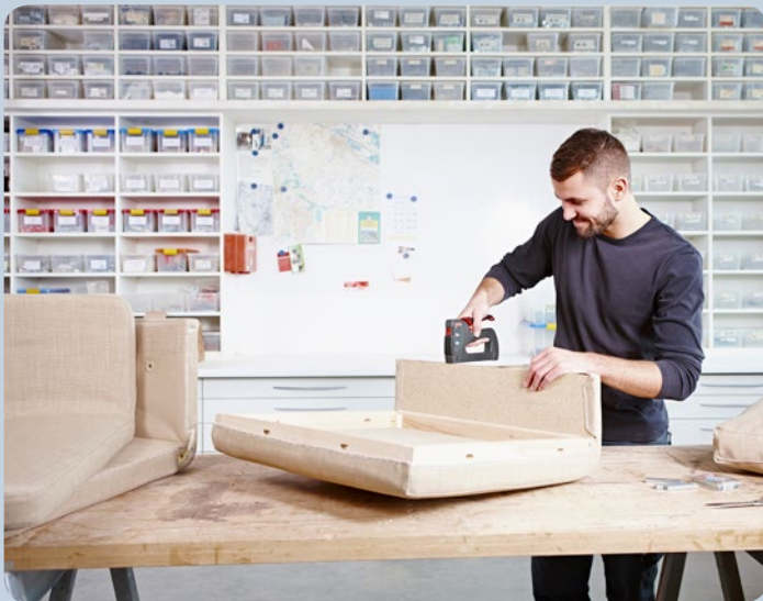
Polsterarbeiten ganz einfach mit dem Tacker erledigen.