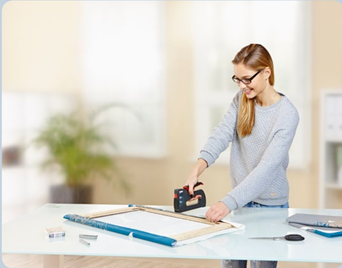
Schnelles Bespannen von Bilderrahmen.