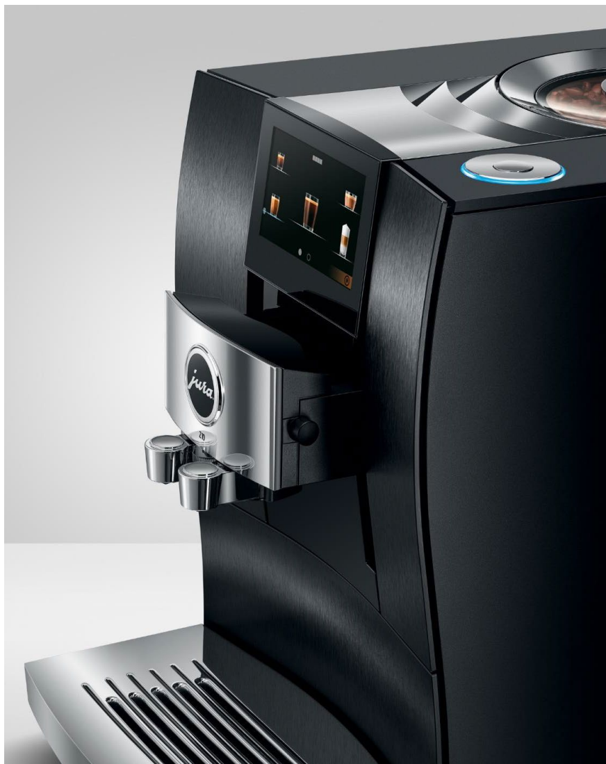
Aluminium Black (EA)