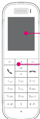
Großes beleuchtetes Farbdisplay