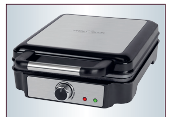
3 Edelstahleinlagen: Deckel, Griff und Front