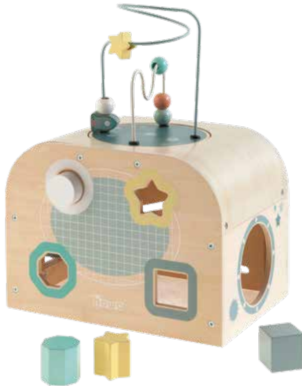
designed by howa ® Spielwaren GmbH