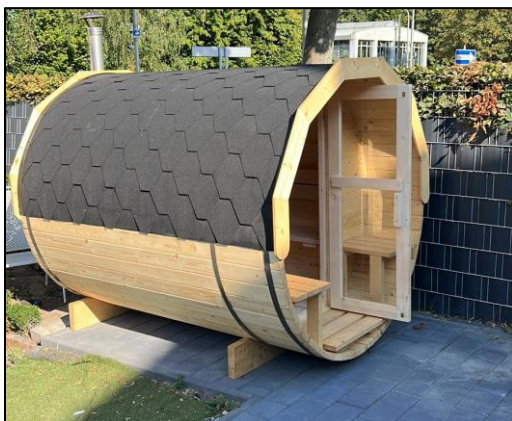
Beispiel ganzes Fundament/Steinplatten