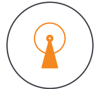
15 km Videoübertragung