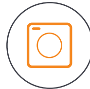
4/3 CMOS Hasselblad-Kamera