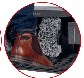
Effizientes Pflegen/Wachsen und Polieren von Schuhen jeglicher Art

Farbe: Anthrazit Artikel-Nr.: 263 944 Artikel EAN-Code: 4 006 160 639 445 Exportkarton EAN-Code: 4 006 160 558 265 VE: 1 20"/40"/HQ Container: 740 / 1480 / 1740