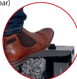
Mühelos und komfortabel mit dem Fuß bedienbar