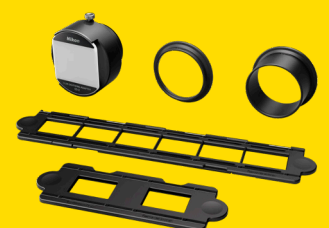
FILMDIGITALISIERUNGS- ADAPTER ES-2