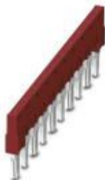
Steckbrücke, Rastermaß: 8,2 mm, Breite: 80,3 mm, Polzahl: 10, Farbe: rot

Bitte beachten Sie, dass die hier angegebenen Daten dem Online-Katalog entnommen sind. Die vollständigen Informationen und Daten entnehmen Sie bitte der Anwenderdokumentation. Es gelten die Allgemeinen Nutzungsbedingungen für Internet-Downloads. ( http://phoenixcontact.de/download )