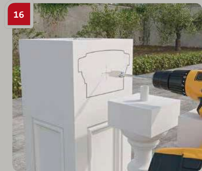
16 Bohren Sie ein Ø12 mm Loch.