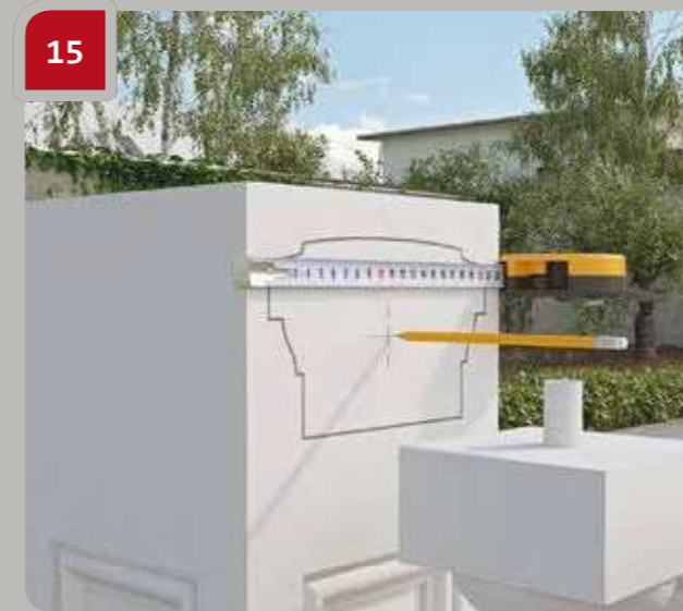
15 Markieren Sie, wo ein Bolzen verankert wird.