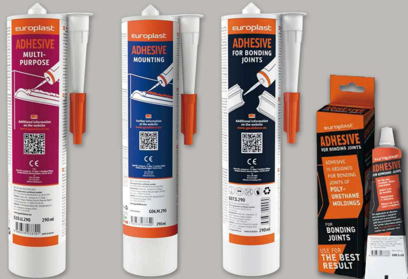
G10U290 290 ml

Bitte beachten Sie das Handbuch und verwenden Sie die vom Hersteller empfohlenen Befestigungswerkzeuge und Klebstoffe: für die Montage verwenden Sie G10U290 für Verbindungen verwenden Sie G07S290 / G08S60.