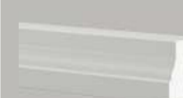
474111 HALBBALUSTRADEN FUSSLAUF