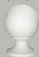
477101 PFOSTENABDECKUNG KUGELFÖRMIG