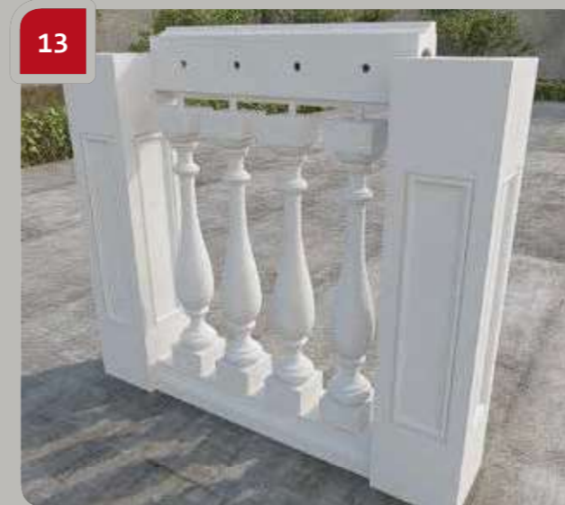
13 Handlauf montieren (Kleber noch nicht auftragen).