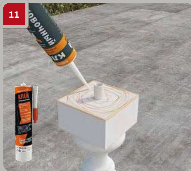
11 G08S60 / G07S290 kleber auf die Unterseite der Baluster auftragen.