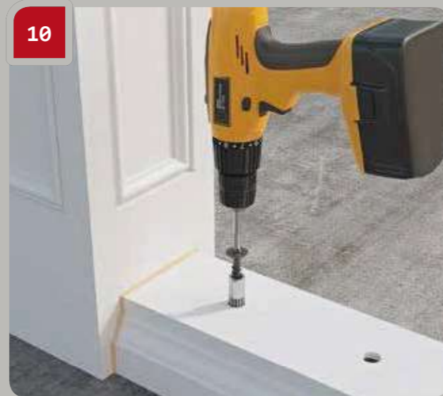
10 Befestigen Sie den Fußlauf mit Ankerbolzen an der Montagefläche durch die vorgebohrten Löcher.