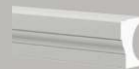
472111 HALBBALUSTRADE HANDLAUF