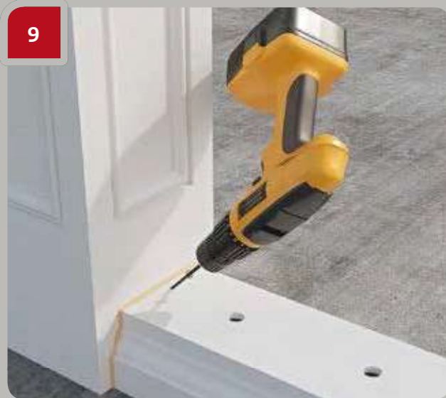
9 Mit Schneidschrauben sichern.