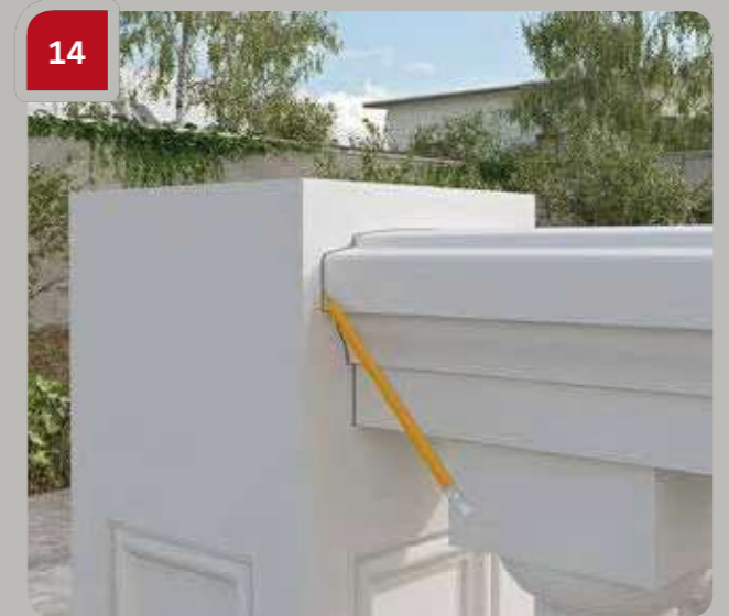
14 Markieren Sie den Umriss des Handlaufs.