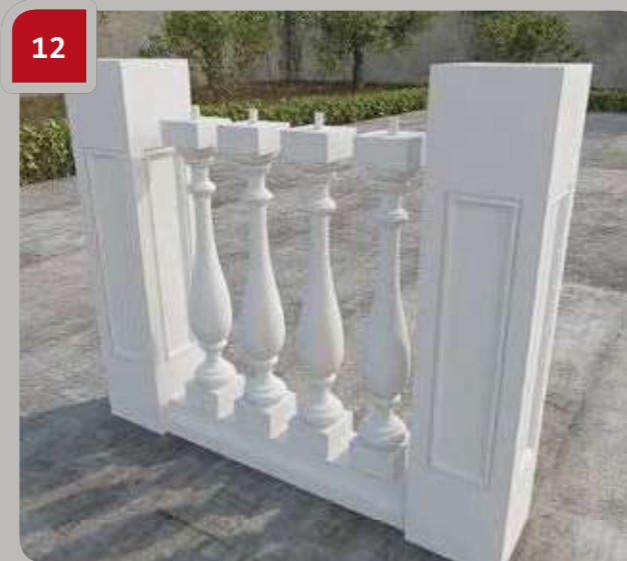
12 Montieren Sie die Baluster in den Fußlauf.