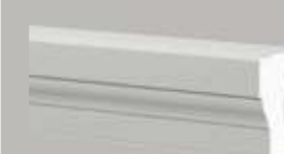
472111 HALBBALUSTRADEN HANDLAUF