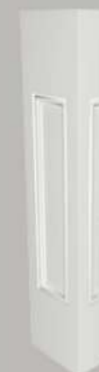
475111 HALBBALUSTRADEN PFOSTEN