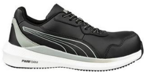
ZOOM BLACK LOW 645030