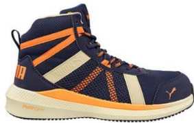
RIVAL BLUE/ORANGE MID 635040