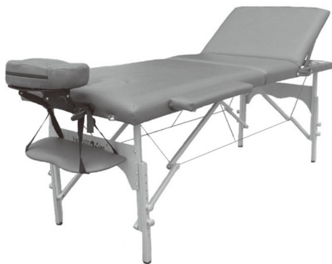
Table de massage portable – 3 zones